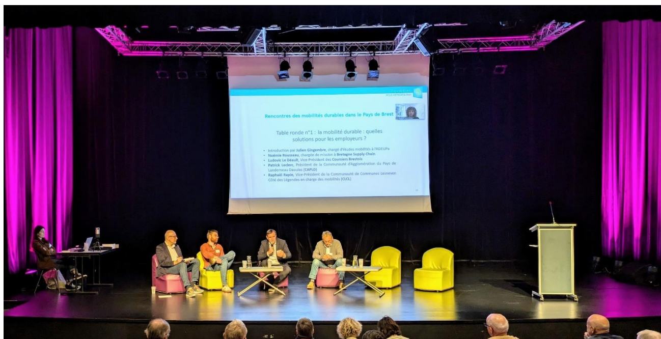
Table ronde n°1

Site internet : https://www.clcl.bzh/amenagement-du-territoire/mobilite