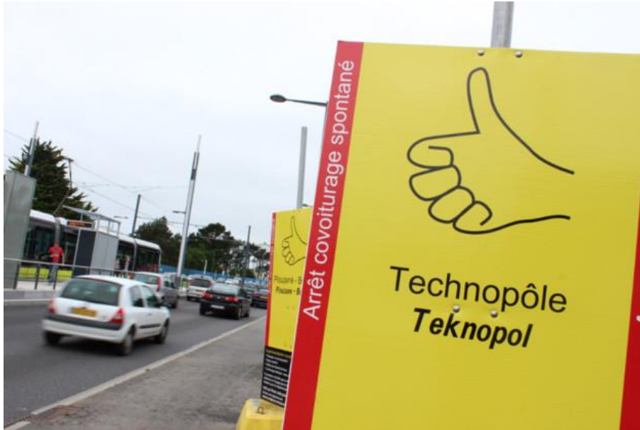
Expérimentation du covoiturage spontané vers le Technopole