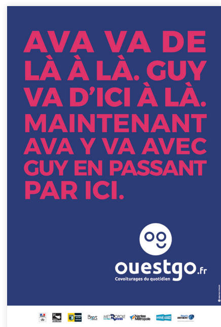
Principe de la story-phrase sur une affiche