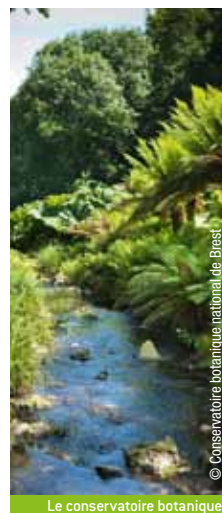
Le conservatoire botanique

Premier pont à haubans de forme courbe jamais construit, cet ouvrage d'art parfaitement intégré dans les méandres de l'Aulne possède des formes étonnantes. Lieu de départ pour une belle randonnée en forêt. 02 98 27 02 92