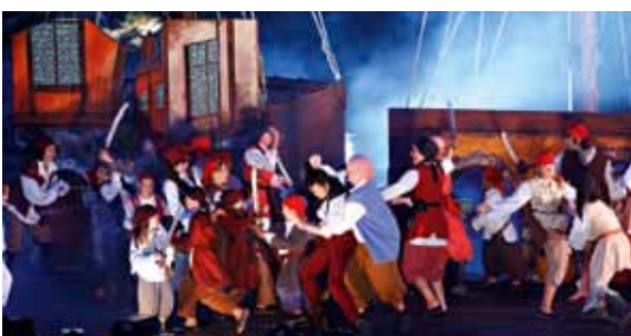
La troupe de théâtre Ar Vro Bagan en action au fort de Bertheaume

Espace muséographique « Du naufrage au renouveau » sur le pétrolier Amoco Cadiz. Expos temporaires. 02 98 48 73 19