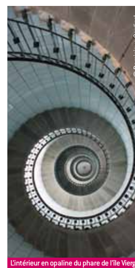
L'intérieur en opaline du phare de l'île Vierge