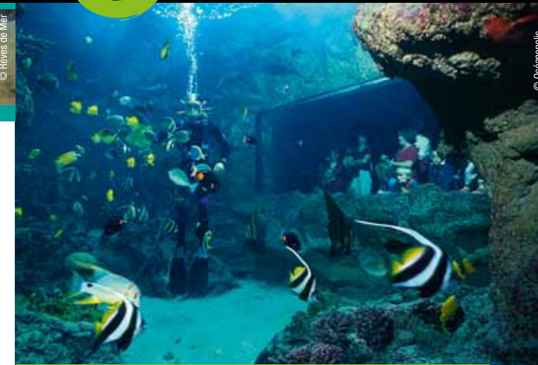
À la découverte des océans, Océanopolis le site incontournable de Brest terres océanes

Les familles plébiscitent Brest terres océanes pour sa concentration de lieux de visites et d'attraction. Des expériences uniques vous attendent à Océanopolis et à la Récré des 3 curés. Côté sites d'exception, le château de Kergroadez mêle avec subtilité la majesté d'un lieu seigneurial et des jardins remarquables. Et ne manquez pas le conservatoire botanique national, véritable « Central park » brestoïis.