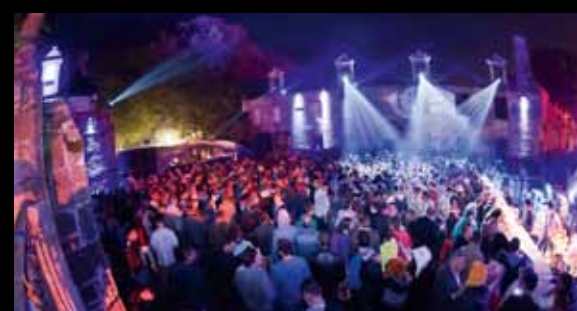
Astropolis, dans les vieilles pierres du manoir de Keroual

C'est au voyage que ce festival nous invite, à la découverte de la production cinématographique de l'Europe entière, réunissant les meilleurs courts métrages de l'année. www.filmcourt.fr