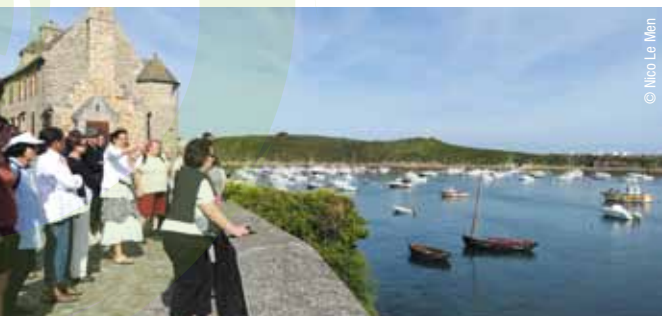
Visite commentée sur le port du Conquet