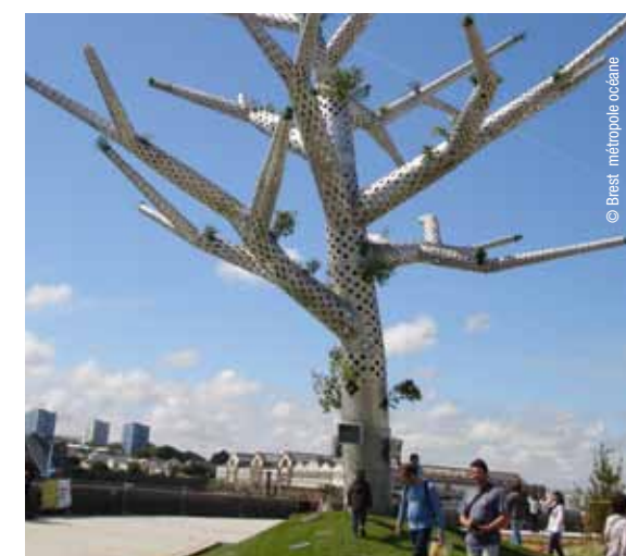
L'arbre empathique, sculpture mi-métal, mi-végétale, au cœur de Brest

Suivez les voiles et embarquez pour une balade qui vous fera découvrir toutes les richesses qui font de Brest une métropole maritime. Visites guidées en été. 02 98 44 24 96