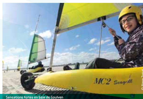
Sensations fortes en baie de Gouven

Brest terres océanes est un haut lieu de pratiques nautiques avec de nombreux petits ports et cinq ports de plaisance : le Château et le Moulin blanc à Brest, l'Aber Wrac'h à Landéda, Camaret et Morgat en presqu'île de Crozon. Pour une balade nautique, embarquez par exemple à bord de la Recouvrance, golette ambassadrice de Brest, pour une sortie à la journée ou quelques jours de croisière.