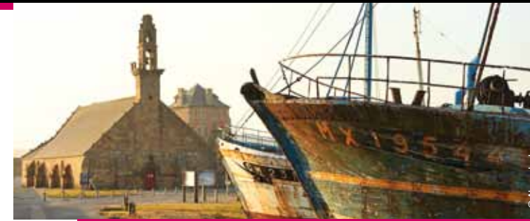
Camaret-sur-Mer et en arrière plan sa tour Vauban inscrite au patrimoine mondial de l'Unesco