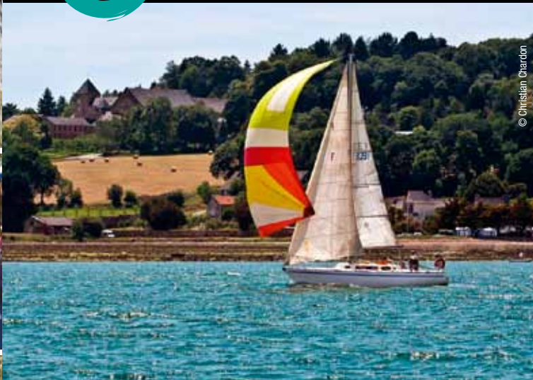
La Pors Beach Amical Cup en rade de Brest, en arrière plan l'abbaye de Landévennec

Partez à la découverte d'une destination maritime par excellence. Brest, port des records, donne sur la plus grande rade d'Europe, plan d'eau praticable toute l'année pour les activités nautiques. Plein ouest, l'Iroise et ses îles sont à l'origine du premier parc naturel marin français. Au sud de la rade, sillonnez la presqu'île de Crozon, ses falaises escarpées et ses points spectaculaires. Et sur la côte nord du Finistère, serpez entre les abers pour atteindre les plages de sable blanc de la côte des Légendes et ses chaos rocheux.