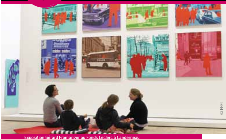
Exposition Gérard Fromanger au Fonds Leclerc à Landerneau

Brest terres océanes est une destination culturelle de premier plan avec le Quartz à Brest, première scène nationale hors Paris et le fonds d'art contemporain à Landerneau, propulsé au premier plan avec l'exposition Miró en 2013. L'abbaye de Daoulas, cloître roman unique en Bretagne, accueille quant à elle des expositions d'envergure et le Musée national de la marine à Brest propose un voyage unique dans la grande aventure navale française.